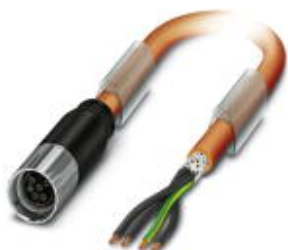
Кабельный штекер, пластиковая заливка, длина: 5 м

Обратите внимание на то, что приведенные здесь данные взяты из online-каталога. Полная информация и данные содержатся в документации пользователя. Действуют Общие условия использования для информации, загруженной из интернета. ( http://phoenixcontact.ru/download )