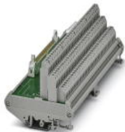
Модуль инициатора VARIOFACE, для подключения 32 инициаторов с выходами типа р-п-р

Обратите внимание на то, что приведенные здесь данные взяты из online-каталога. Полная информация и данные содержатся в документации пользователя. Действуют Общие условия использования для информации, загруженной из интернета. ( http://phoenixcontact.ru/download )