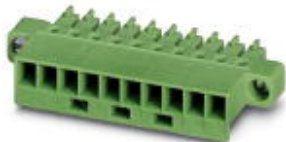
На рисунке показан 10-контактный вариант

Разъемы для печатной платы, номинальный ток: 8 А, расчетное напряжение (III/2): 160 В, полюсов: 12, размер шага: 3,81 мм, тип подключения: Обжим, цвет: зеленый, Соответствующие обжимные гнездовые контакты с параметрами номинального тока (А) и сечений проводников (мм 2 ) 5А/МСС-МТ 0,2-0,35 (1859988); 8А/МСС-МТ 0,5-1,0 (1859991)