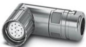
На рисунке показана 12-контактная модель изделия

Кабельный соединитель, угловой, экранирован.: есть, Винтовой зажим, M23, Полюсов: 16, тип контактов: Розетка, Подключение пайкой, диапазон диаметра кабеля: 10 мм ... 14,5 мм