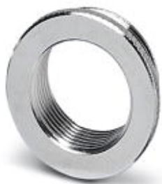
Переходник M25/M20, с уплотнительным кольцом

Обратите внимание на то, что приведенные здесь данные взяты из online-каталога. Полная информация и данные содержатся в документации пользователя. Действуют Общие условия использования для информации, загруженной из интернета. ( http://phoenixcontact.ru/download )