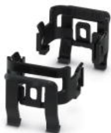
Соединительный элемент, конструкция: B6 - B24

Обратите внимание на то, что приведенные здесь данные взяты из online-каталога. Полная информация и данные содержатся в документации пользователя. Действуют Общие условия использования для информации, загруженной из интернета. ( http://phoenixcontact.ru/download )