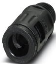
Резьбовое соединение кабеля, резьба Pg, класс защиты IP68/69k, прямое

Обратите внимание на то, что приведенные здесь данные взяты из online-каталога. Полная информация и данные содержатся в документации пользователя. Действуют Общие условия использования для информации, загруженной из интернета. ( http://phoenixcontact.ru/download )