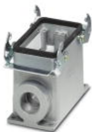
Приборный корпус HEAVYCON, D50, с поперечной защелкой, высота 81 мм, с 1 патрубком M32

Обратите внимание на то, что приведенные здесь данные взяты из online-каталога. Полная информация и данные содержатся в документации пользователя. Действуют Общие условия использования для информации, загруженной из интернета. ( http://phoenixcontact.ru/download )