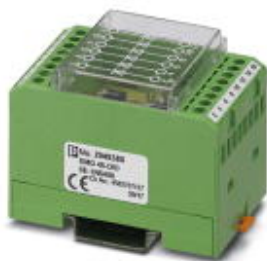
Диодная сборка, 8 диодов с отдельными выводами, тип диодов 1N 5408

Обратите внимание на то, что приведенные здесь данные взяты из online-каталога. Полная информация и данные содержатся в документации пользователя. Действуют Общие условия использования для информации, загруженной из интернета. ( http://phoenixcontact.ru/download )