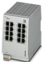
Managed Switch 2000, 16 порты RJ45 10/100/1000 Мбит/с, степень защиты: IP20

Обратите внимание на то, что приведенные здесь данные взяты из online-каталога. Полная информация и данные содержатся в документации пользователя. Действуют Общие условия использования для информации, загруженной из интернета. ( http://phoenixcontact.ru/download )