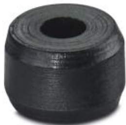
Фиксирующее кольцо для предварительной установки инструмента

Обратите внимание на то, что приведенные здесь данные взяты из online-каталога. Полная информация и данные содержатся в документации пользователя. Действуют Общие условия использования для информации, загруженной из интернета. ( http://phoenixcontact.ru/download )