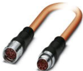
Штекерный разъем, пластиковая заливка с обеих сторон, длина: 10 м, цвет наружной оболочки: оранжевый RAL 2003

Обратите внимание на то, что приведенные здесь данные взяты из online-каталога. Полная информация и данные содержатся в документации пользователя. Действуют Общие условия использования для информации, загруженной из интернета. ( http://phoenixcontact.ru/download )