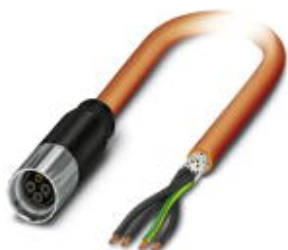
Кабельный штекер, пластиковая заливка, длина: 5 м, цвет наружной оболочки: оранжевый RAL 2003

Обратите внимание на то, что приведенные здесь данные взяты из online-каталога. Полная информация и данные содержатся в документации пользователя. Действуют Общие условия использования для информации, загруженной из интернета. ( http://phoenixcontact.ru/download )