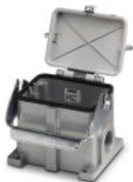
Приборный корпус HEAVYCON B 48, с одной защелкой, высота 100 мм, с опорами 2 x M40, с крышкой

Обратите внимание на то, что приведенные здесь данные взяты из online-каталога. Полная информация и данные содержатся в документации пользователя. Действуют Общие условия использования для информации, загруженной из интернета. ( http://phoenixcontact.ru/download )