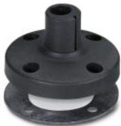
Основание для трубы диам. 25 мм, пластмассовое, черное

Обратите внимание на то, что приведенные здесь данные взяты из online-каталога. Полная информация и данные содержатся в документации пользователя. Действуют Общие условия использования для информации, загруженной из интернета. ( http://phoenixcontact.ru/download )