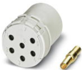
Модуль для контактов, полюсов: 6, тип контактов: Розетка, Обжим

Обратите внимание на то, что приведенные здесь данные взяты из online-каталога. Полная информация и данные содержатся в документации пользователя. Действуют Общие условия использования для информации, загруженной из интернета. ( http://phoenixcontact.ru/download )