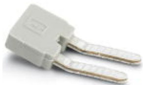
На рисунке показан 2-контактный вариант

Гребенчатый мостик, полностью изолированный, для разъемов с шагом 5,0 или 5,08 мм, количество полюсов: 6