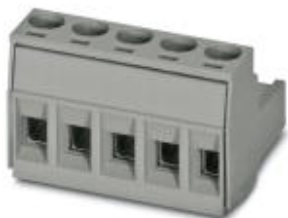
На рисунке показан 5-контактный вариант изделия

Обратите внимание на то, что приведенные здесь данные взяты из online-каталога. Полная информация и данные содержатся в документации пользователя. Действуют Общие условия использования для информации, загруженной из интернета. ( http://phoenixcontact.ru/download )