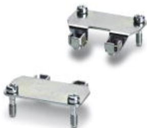
Адаптерный модуль, конструкция: D25

Обратите внимание на то, что приведенные здесь данные взяты из online-каталога. Полная информация и данные содержатся в документации пользователя. Действуют Общие условия использования для информации, загруженной из интернета. ( http://phoenixcontact.ru/download )