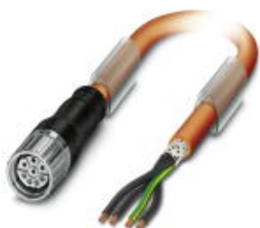
Кабельный штекер, пластиковая заливка, длина: 2 м, цвет наружной оболочки: оранжевый RAL 2003

Обратите внимание на то, что приведенные здесь данные взяты из online-каталога. Полная информация и данные содержатся в документации пользователя. Действуют Общие условия использования для информации, загруженной из интернета. ( http://phoenixcontact.ru/download )