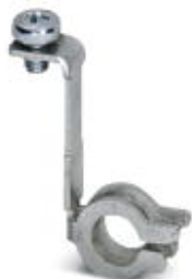
Контакт PE для установочных корпусов UM-PRO для соединения печатной платы третьего уровня с монтажной рейкой

Обратите внимание на то, что приведенные здесь данные взяты из online-каталога. Полная информация и данные содержатся в документации пользователя. Действуют Общие условия использования для информации, загруженной из интернета. ( http://phoenixcontact.ru/download )