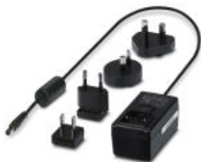
Блок питания для работы принтера THERMOFOX

Обратите внимание на то, что приведенные здесь данные взяты из online-каталога. Полная информация и данные содержатся в документации пользователя. Действуют Общие условия использования для информации, загруженной из интернета. ( http://phoenixcontact.ru/download )