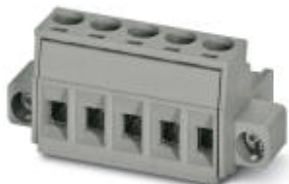
На рисунке показан 5-контактный вариант изделия серого цвета

Разъемы для печатной платы, номинальный ток: 12 А, расчетное напряжение (III/2): 320 В, полюсов: 3, размер шага: 5 мм, тип подключения: Винтовой зажим с натяжной гильзой, цвет: бело-зеленый, поверхность контакта: олово