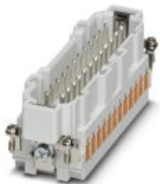
Штекерный разъем, 24-контактный, тип подключения QUICKO, маркировка 1-х

Обратите внимание на то, что приведенные здесь данные взяты из online-каталога. Полная информация и данные содержатся в документации пользователя. Действуют Общие условия использования для информации, загруженной из интернета. ( http://phoenixcontact.ru/download )