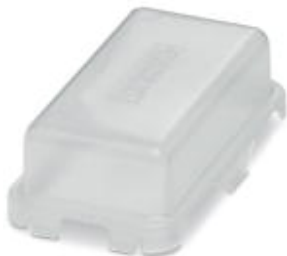
Защитная крышка, конструкция: B10, степень защиты: IP20, цвет: прозрачный/белый

Обратите внимание на то, что приведенные здесь данные взяты из online-каталога. Полная информация и данные содержатся в документации пользователя. Действуют Общие условия использования для информации, загруженной из интернета. ( http://phoenixcontact.ru/download )