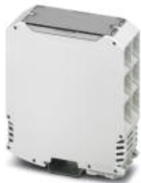
Корпуса для установки на несущую рейку, с вентиляционными отверстиями, ширина: 35 мм

Обратите внимание на то, что приведенные здесь данные взяты из online-каталога. Полная информация и данные содержатся в документации пользователя. Действуют Общие условия использования для информации, загруженной из интернета. ( http://phoenixcontact.ru/download )