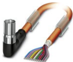
Кабельный штекер, пластиковая заливка, длина: 10 м, цвет наружной оболочки: оранжевый RAL 2003

Обратите внимание на то, что приведенные здесь данные взяты из online-каталога. Полная информация и данные содержатся в документации пользователя. Действуют Общие условия использования для информации, загруженной из интернета. ( http://phoenixcontact.ru/download )