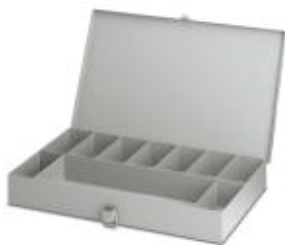
Металлическая коробка, пустая

Обратите внимание на то, что приведенные здесь данные взяты из online-каталога. Полная информация и данные содержатся в документации пользователя. Действуют Общие условия использования для информации, загруженной из интернета. ( http://phoenixcontact.ru/download )