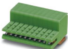
На рисунке показан 10-контактный вариант изделия

Обратите внимание на то, что приведенные здесь данные взяты из online-каталога. Полная информация и данные содержатся в документации пользователя. Действуют Общие условия использования для информации, загруженной из интернета. ( http://phoenixcontact.ru/download )