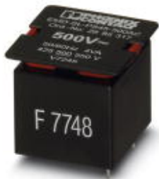
Питающий модуль, вставной, для EMD-SL-..., напряжение питания: 425...550 В AC

Обратите внимание на то, что приведенные здесь данные взяты из online-каталога. Полная информация и данные содержатся в документации пользователя. Действуют Общие условия использования для информации, загруженной из интернета. ( http://phoenixcontact.ru/download )