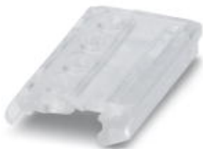
Выталкиватель для штекеров COMBICON

Обратите внимание на то, что приведенные здесь данные взяты из online-каталога. Полная информация и данные содержатся в документации пользователя. Действуют Общие условия использования для информации, загруженной из интернета. ( http://phoenixcontact.ru/download )