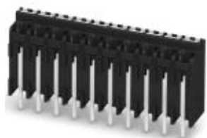
На рисунке показан 10-полюсный вариант

Обратите внимание на то, что приведенные здесь данные взяты из online-каталога. Полная информация и данные содержатся в документации пользователя. Действуют Общие условия использования для информации, загруженной из интернета. ( http://phoenixcontact.ru/download )