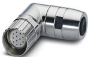
На рисунке показана 12-контактная модель изделия

Кабельный соединитель, угловой, экранирован.: есть, Винтовой зажим, M23, Полюсов: 8+1, тип контактов: Розетка, Обжим, диапазон диаметра кабеля: 2 мм ... 14,5 мм