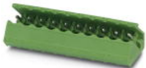
На рисунке показан 10-контактный вариант изделия

Корпусная часть для печатных плат, номинальный ток: 12 А, расчетное напряжение (III/2): 320 В, полюсов: 4, размер шага: 5 мм, цвет: зеленый, поверхность контакта: олово, монтаж: Пайка волной припоя