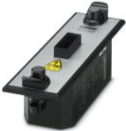
Тестовый адаптер CHECKMASTER 2 для устройств серии PLT-SEC...UT/PT, 17,5 мм

Обратите внимание на то, что приведенные здесь данные взяты из online-каталога. Полная информация и данные содержатся в документации пользователя. Действуют Общие условия использования для информации, загруженной из интернета. ( http://phoenixcontact.ru/download )