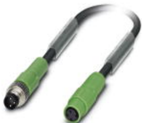
Кабель для датчика / исполнительного элемента, 3-полюсн., PUR без галогенов, темно-серый RAL 7021, Штекеры прямое M8, к Гнездо прямое M8 Snap-In, длина кабеля: 0,6 м

Обратите внимание на то, что приведенные здесь данные взяты из online-каталога. Полная информация и данные содержатся в документации пользователя. Действуют Общие условия использования для информации, загруженной из интернета. ( http://phoenixcontact.ru/download )