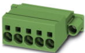
На рисунке показан 5-контактный вариант изделия

Разъемы для печатной платы, номинальный ток: 41 А, расчетное напряжение (III/2): 1000 В, полюсов: 12, размер шага: 7,62 мм, тип подключения: Пружинные зажимы Push-in, цвет: зеленый, поверхность контакта: олово