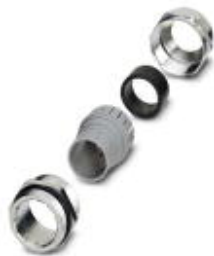
Латунный резьбовой элемент, PG21

Обратите внимание на то, что приведенные здесь данные взяты из online-каталога. Полная информация и данные содержатся в документации пользователя. Действуют Общие условия использования для информации, загруженной из интернета. ( http://phoenixcontact.ru/download )