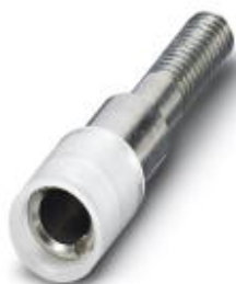
Гнездо для щупа тестера, цвет: бесцветный

Обратите внимание на то, что приведенные здесь данные взяты из online-каталога. Полная информация и данные содержатся в документации пользователя. Действуют Общие условия использования для информации, загруженной из интернета. ( http://phoenixcontact.ru/download )