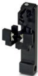
Комплект 1,5 мм 2 для автоматического устройства для обжима CF 3000-2,5

Обратите внимание на то, что приведенные здесь данные взяты из online-каталога. Полная информация и данные содержатся в документации пользователя. Действуют Общие условия использования для информации, загруженной из интернета. ( http://phoenixcontact.ru/download )