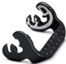
Запасная пластмассовая защелка для стандартных корпусов типа B10

Обратите внимание на то, что приведенные здесь данные взяты из online-каталога. Полная информация и данные содержатся в документации пользователя. Действуют Общие условия использования для информации, загруженной из интернета. ( http://phoenixcontact.ru/download )