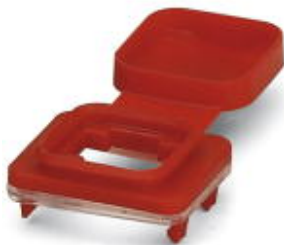
Защита IP54 с цветовой маркировкой для коммутатора SFN и угловой патч-панелью, красная

Обратите внимание на то, что приведенные здесь данные взяты из online-каталога. Полная информация и данные содержатся в документации пользователя. Действуют Общие условия использования для информации, загруженной из интернета. ( http://phoenixcontact.ru/download )