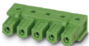
На рисунке показан 5-контактный вариант

Корпусная часть для печатных плат, номинальный ток: 16 А, расчетное напряжение (III/2): 630 В, полюсов: 10, размер шага: 7,62 мм, цвет: зеленый, поверхность контакта: олово, монтаж: Пайка волной припоя