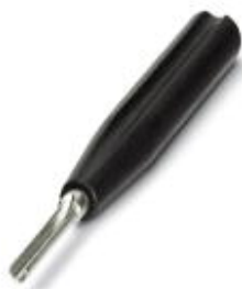
Инструмент для монтажа и демонтажа штыревых и гнездовых обжимных контактов RC диаметром 1 мм

Обратите внимание на то, что приведенные здесь данные взяты из online-каталога. Полная информация и данные содержатся в документации пользователя. Действуют Общие условия использования для информации, загруженной из интернета. ( http://phoenixcontact.ru/download )