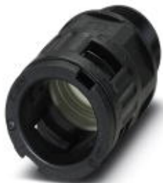
Резьбовое соединение кабеля, резьба Pg, класс защиты IP68/69k, прямое

Обратите внимание на то, что приведенные здесь данные взяты из online-каталога. Полная информация и данные содержатся в документации пользователя. Действуют Общие условия использования для информации, загруженной из интернета. ( http://phoenixcontact.ru/download )