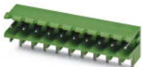
На рисунке показан 10-контактный вариант изделия

Корпусная часть для печатных плат, номинальный ток: 12 А, расчетное напряжение (III/2): 320 В, полюсов: 24, размер шага: 5,08 мм, цвет: зеленый, поверхность контакта: олово, монтаж: Пайка волной припоя