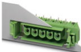
На рисунке показан 5-контактный вариант изделия

Компоненты для проходного монтажа, номинальный ток: 76 А, расчетное напряжение (III/2): 1000 В, полюсов: 3, размер шага: 10,16 мм, цвет: зеленый, поверхность контакта: Серебро, монтаж: Пайка волной припоя