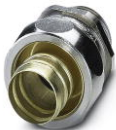
Резьбовое соединение кабеля из латуни с метрической резьбой, класс защиты IP65

Обратите внимание на то, что приведенные здесь данные взяты из online-каталога. Полная информация и данные содержатся в документации пользователя. Действуют Общие условия использования для информации, загруженной из интернета. ( http://phoenixcontact.ru/download )