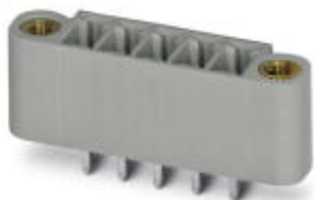
На рисунке показан 5-контактный вариант изделия серого цвета

Корпусная часть для печатных плат, номинальный ток: 8 А, расчетное напряжение (III/2): 160 В, полюсов: 17, размер шага: 3,5 мм, цвет: черный, поверхность контакта: олово, монтаж: Пайка волной припоя