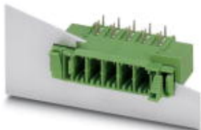
На рисунке показан 5-контактный вариант изделия

Компоненты для проходного монтажа, номинальный ток: 41 А, расчетное напряжение (III/2): 630 В, полюсов: 6, размер шага: 7,62 мм, цвет: зеленый, поверхность контакта: олово, монтаж: Пайка волной припоя